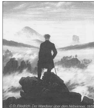
C.D. Friedrich: Der Wanderer über dem Nebelmeer, 1818

Als Rastplatz wählte er den Ausstellungsraum der WEKA Hotels Bad Schandau GmbH am Krippener Marktplatz. Dort wird bis zum Jahresende das Präsentationsunikat der Sonderbriefmarke mit dem gleichnamigen Motiv gezeigt. Am 04.01.2011 wurde in Bad Schandau die Briefmarke in einer würdevollen Umrahmung feierlich vorgestellt. Das Entgegenkommen des Tourismusverbandes Sächsische Schweiz e. V., Pirna,